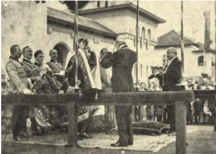
Încoronarea Regelui Ferdinand I – Alba Iulia