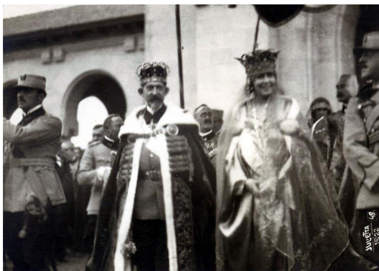
Încoronarea de la Alba Iulia