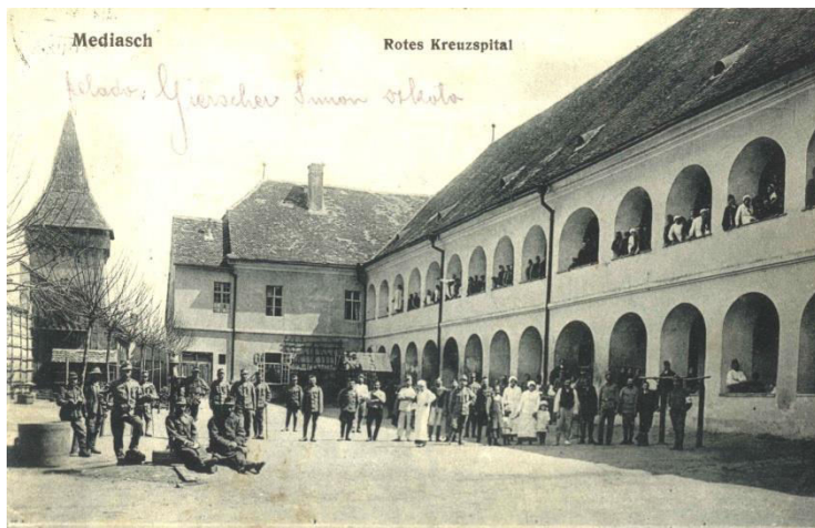
Spitalul de campanie al Crucii Roșii din perioada Primului Război Mondial de la Mediaș