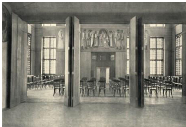
Gimnaziul Evanghelic „St. L. Roth” din Mediaș și Sala Festivă în care a avut loc Adunarea Generală a Sașilor din Transilvania