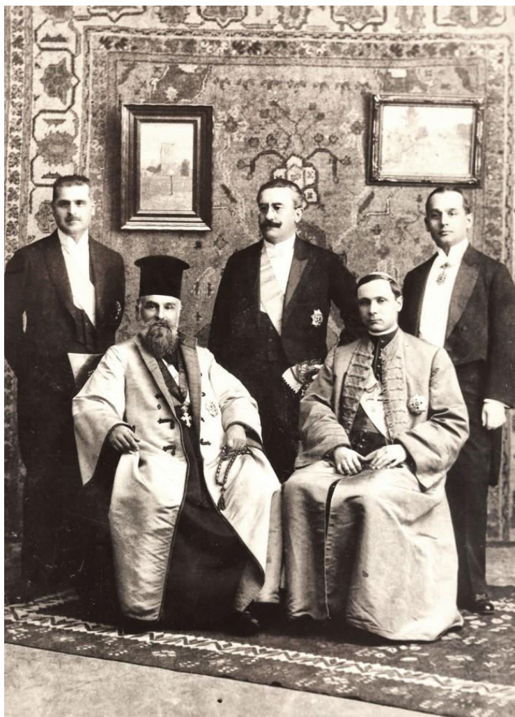
Delegația din Transilvania care a înmânat actul unirii regelui Ferdinand în 1918 (Vasile Goldiș, Miron Cristea, Iuliu Hossu, Alexandru Vaida-Voievod și Caius Brediceanu)