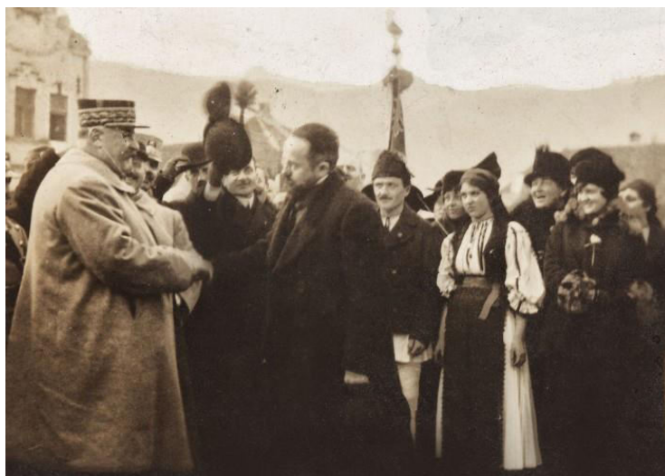
Generalul H. M. Berthelot în vizita oficială din Transilvania, 1919